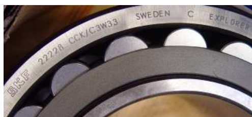
Крупный план всех обозначений, видимых на продукции (при необходимости сделайте несколько фотографий)