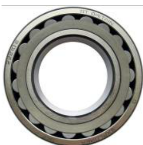
Общий вид приобретенной продукции