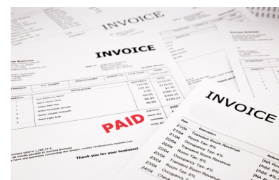
Дополнительные документы, например, накладные, счета-фактуры, сертификаты и пр.