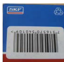
Штрих-код, а также любые видимые этикетки