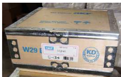
Общий вид тары