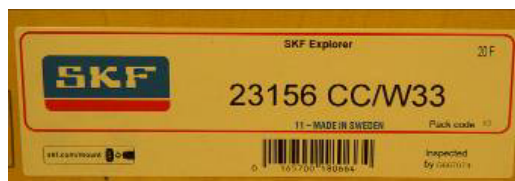
Наклейки, маркировки, штрих-коды или обозначения, видимые на таре